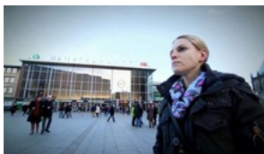
OPFER ÜBER DIE KÖLNER SILVESTERNACHT "Wir hatten Angst um unser Leben"

Die Polizei will die Kriminellen unter den Flüchtlingen und Asylbewerbern aufspüren. Viele sind illegal in Deutschland. Nach einem Großeinsatz mit 300 Beamten und 40 Festnahmen im Düsseldorfer Bahnhofsviertel gab es am Dienstagabend auch in Köln-Kalk eine Razzia. 120 Personen wurden überprüft. Im Visier der Fahnder: Nordafrikanische Tätergruppen.